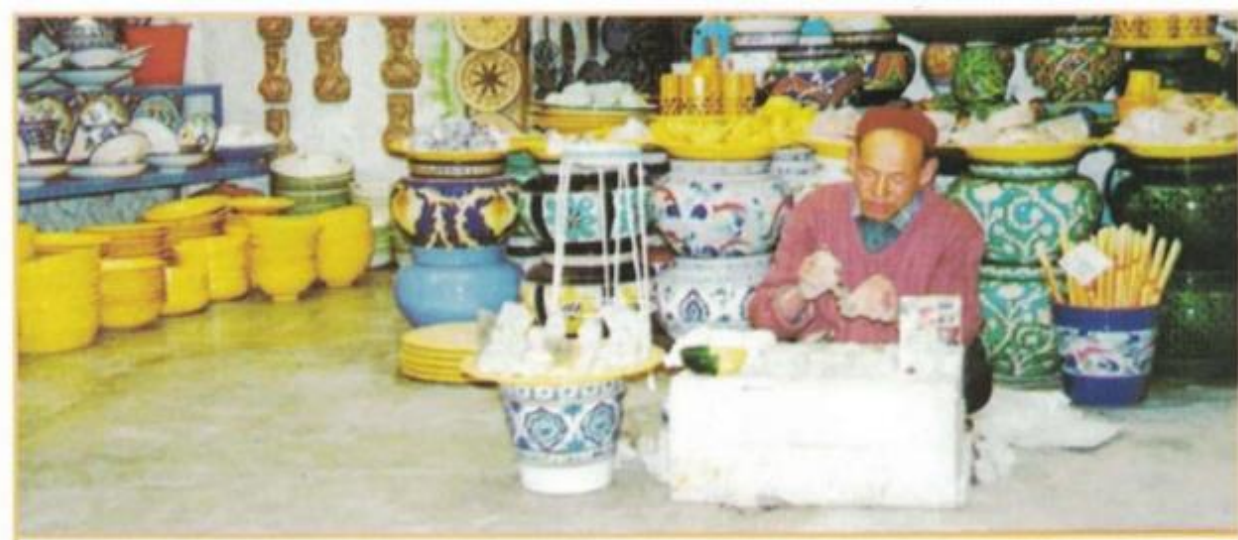
صِنَاعَةُ الْفَخَّارِ التَّقْلِيدِيَّةِ