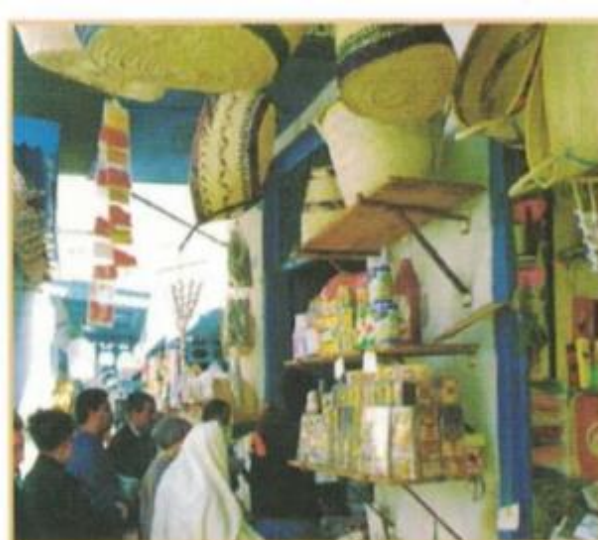
مَتَجَرٌ فِي تُونِسَ